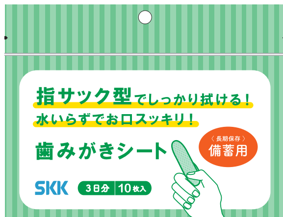
▲歯みがきシート 3日分/10枚入